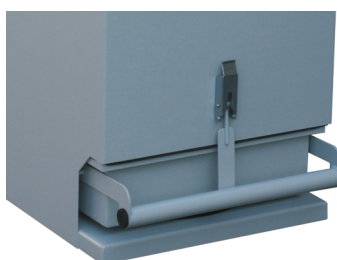
Detail prachové nádoby s pákovým uzavíracím mechanismem

Odprašovače BASIC A jsou kompletně zkoušeny a prověřovány zkušební a certifikační organizací.