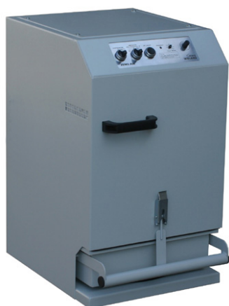
BASICA - pohled zepředu