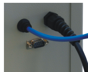
Detail připojení - tlakový vzduch, SUB-9 PC zásuvka, napájecí kabel