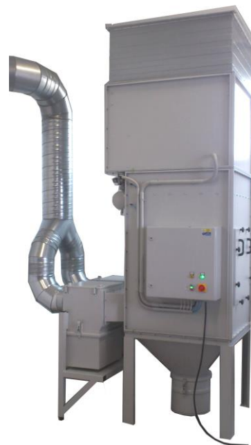
STANDARD VI - s tlumičem hluku a odlučovačem jisker DUO